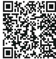
กำหนดการ และแผนที่ ครั้งที่ ๔