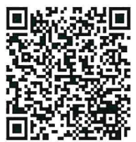
เอกสารประกอบ ประชุม