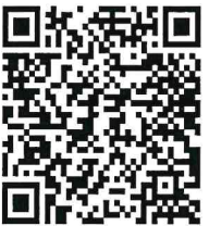
กำหนดการ และแผนที่ ครั้งที่ ๒