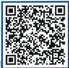
QR Code download เอกสารประกอบ